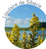
Ligulaire de Sibérie