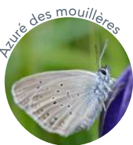
Azuré des mouillères