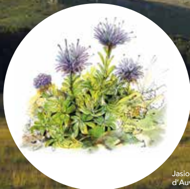
Jasione crépue d'Auvergne

Cette biodiversité exceptionnelle est liée à la grande variété de milieux naturels, aux différentes altitudes et à son statut de réserve naturelle qui permet une bonne préservation.