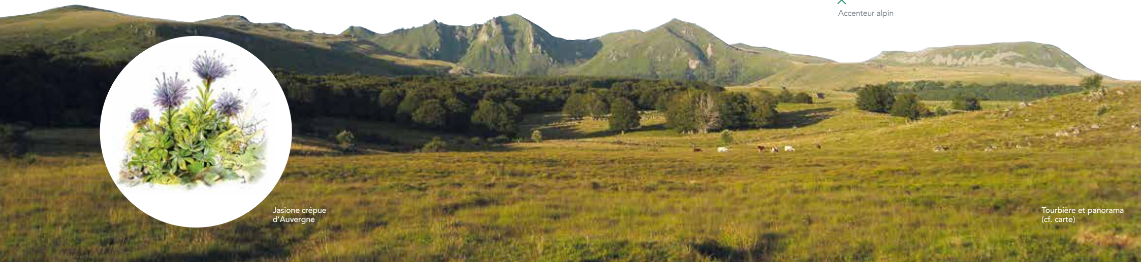
Tourbière et panorama (cf. carte)